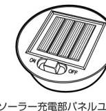
ソーラー充電部パネルユニット

ソーラー充電パネルの消耗や事故などの損傷による動作不良の際は弊社「お客様相談窓口」にて交換品をお買い求め下さい。（TEL 0570-030-800）